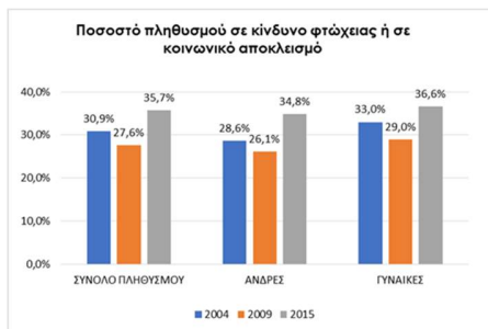
Ποσοστό πληθυσμού σε κίνδυνο φτώχειας ή σε κοινωνικό αποκλεισμό

Αρχικά, παρατηρούμε πως το ποσοστό του πληθυσμού σε κίνδυνο φτώχειας ή σε κοινωνικό αποκλεισμό μειώθηκε από το 2004 στο 2009 κατά 3,3 ποσοστιαίες μονάδες φτάνοντας στο 27,6%. Την εξαιτία της κρίσης (2009 – 2015), είχαμε ραγδαία αύξηση της τάξης των 8,1 ποσοστιαίων μονάδων φτάνοντας το 2015 το 35,7%, μείωση που αντισταθμίζει πλήρως ολόκληρη τη θετική εξέλιξη της προηγούμενης περιόδου (2004-2009). Έτσι, το σημερινό επίπεδο φτώχειας αντιστοιχεί κατ' εκτίμηση, περίπου σε επίπεδα γύρω από το έτος 2000.